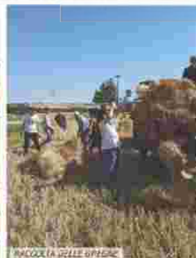
RACCOLTA DELLE SPICCE