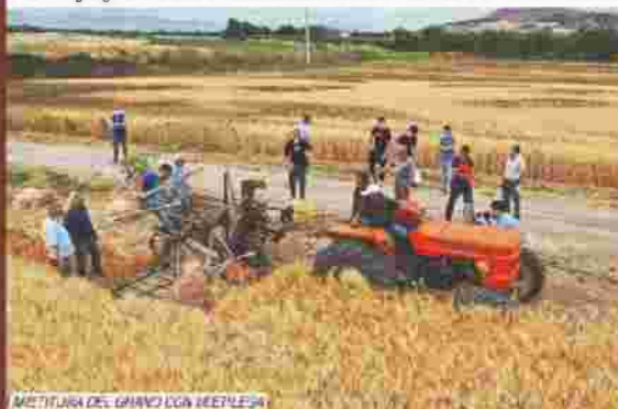
MIETITURA DEL GRANO CON MIETELLE

L'11 giugno è stata effettuata la mietitura manuale e meccanica nell'azienda agraria dell'IISS "G. Solimene" in contrada Isca San Mauro.