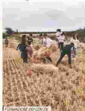
FORMAZIONE DEL CONVIO